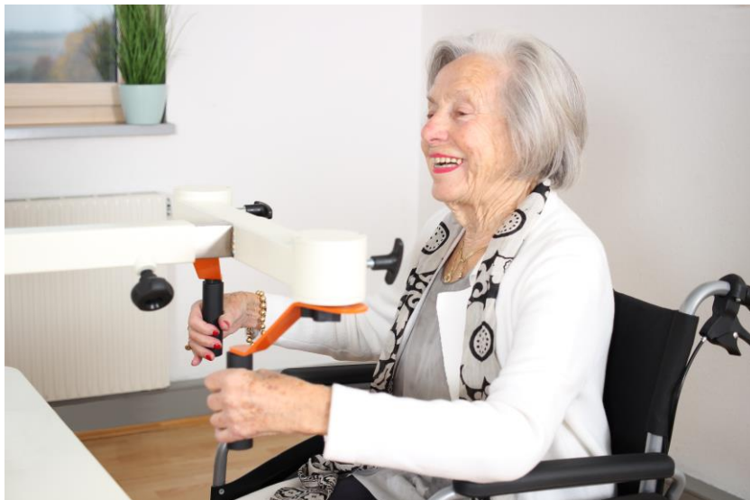
Bild 5: Rollstühle lassen sich mit einer integrierten Rollstuhlsicherung am Plaudertisch fixieren.