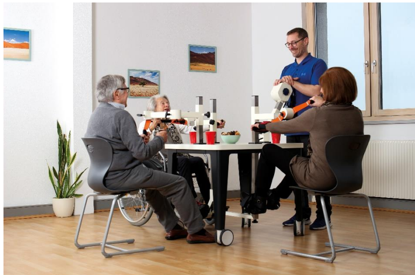
Bild 3: Beim gemeinsamen Training an einem Tisch singen und plaudern die Senioren gerne miteinander.