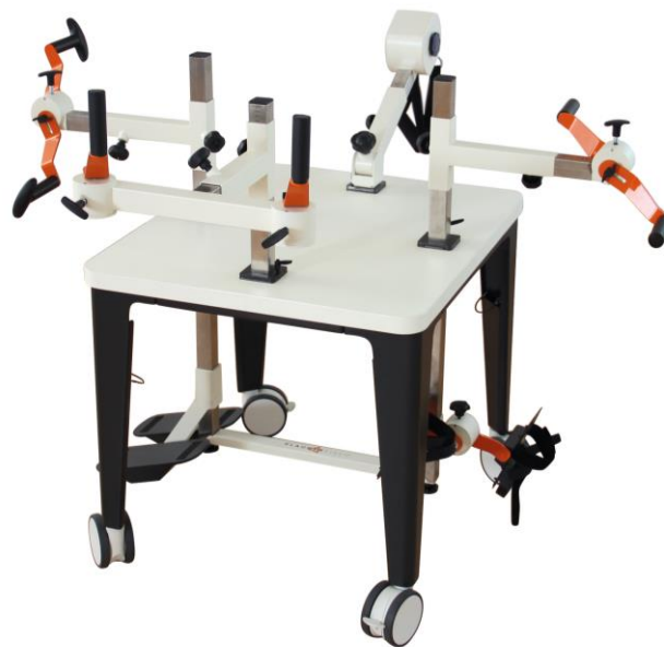
Bild 1: Am kleinen Plaudertisch ist Platz für vier Personen. Am Tisch sind Übungsgeräten wie die Kaffeemühle (auf dem Tisch, Mitte-vorne), der Rasenmäher (auf dem Tisch, Mitte-hinten), die Drehorgel (auf dem Tisch, links und rechts), die Nähmaschine (unter dem Tisch, links) und das Fahrrad (unter dem Tisch, rechts) befestigt.

Eine neu entwickelte Produktvariante des Plaudertischs überträgt die Bewegungen direkt in digitale Spiele und andere Anwendungen und macht sie über Bildschirme erlebbar. Das soll zusätzlich zur Bewegung motivieren und die Durchführung von Übungsrunden für die Pflegekräfte vereinfachen.