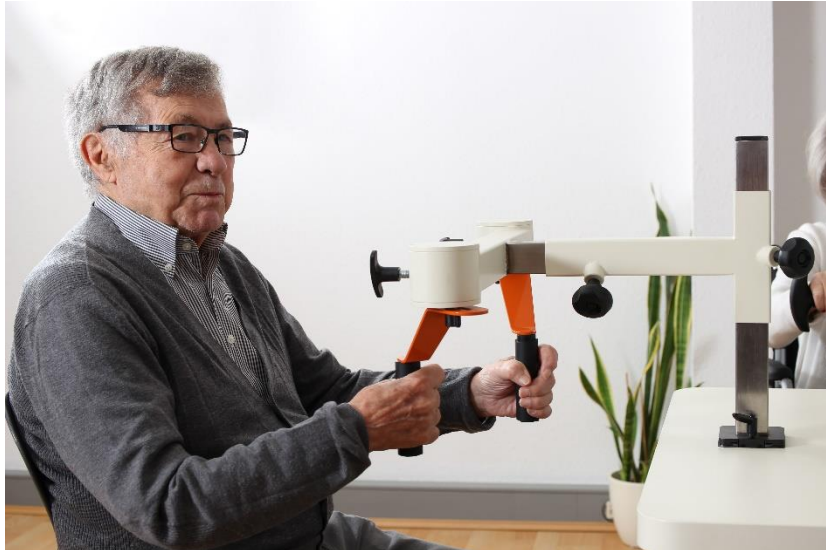
Bild 2: Der Plaudertisch bringt Geselligkeit, Spaß und Bewegung an einem Tisch zusammen.